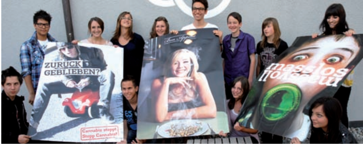
Die drei bestplatzierten Teams der Kategorien Cannabis, Tabak, Alkohol