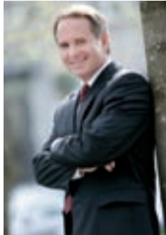
Regierungsrat Stefan Kölliker im Interview