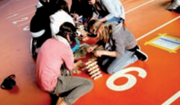
Mit der Rauschbrille sieht vieles anders aus.